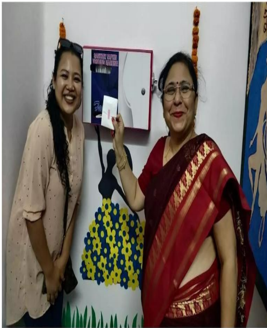
Inauguration of sanitary pad vending machine