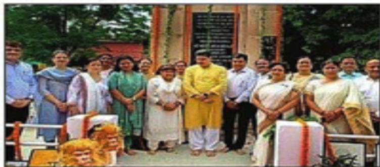
महात्मा गांधी और लाल बहादुर शास्त्री की जयंती पर सोमवार को लखिवि में कार्यक्रम आयोजित हुआ।