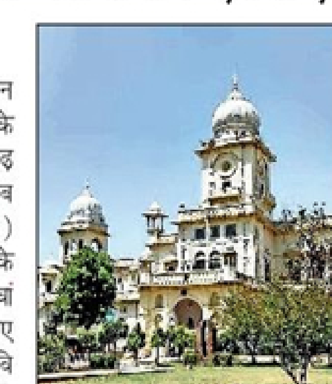
फायदा होगा जो दवाओं के तकनीकी ज्ञान के साथ-साथ उनके बाजार प्रबंधन की बागिकियां भी सीखना चाहते हैं। LU अब नौ विषयों में कराएगा MBA : इस नए कोर्स के साथ अब एलयू में कुल 9 विषय हो गए हैं, जिसमें एमबीए पाठ्यक्रम संचालित किया जा रहा है। इसमें फार्मसी, मार्केटिंग, ह्यूमन रिसोर्स इंटरनेशनल बिजनेस, जो ओल्ड कैम्पस के मैनेजमेंट विभाग में संचालित होते हैं। वहीं, कॉमर्स में विभाग एमबीए (फार्मनास एंड अकाउंटिंग) संचालित हो रहा है। न्यू कैम्पस के मैनेजमेंट स्ट्रॉन्ग संस्थान में ह्यूमन रिसोर्स, इंटरनेशनल बिजनेस, मार्केटिंग, फार्मनास एंड एंड ट्रेवल मैनेजमेंट संचालित हो रहा है।

लखनऊ विश्वविद्यालय में प्रबंधन की पढ़ाई करने के इच्छुक छात्रों के लिए अब अवसरों का द्युता और बढ़ गया है। विवि का फार्मसी विभाग अब एमबीए (फार्मास्यूटिकल मैनेजमेंट) कोर्स शुरू करने जा रहा है। इसी के साथ फार्मसी विभाग एलयू का पांचवां ऐसा विभाग बन गया है, जहां एमबीए प्रोग्राम संचालित होगा। इससे पहले विवि के मैनेजमेंट विभाग (ओल्ड कैम्पस), आइएमएस (न्यू कैम्पस) और कॉमर्स विभाग, टूरिज्म में पहले से ही विभिन्न विशेषताओं के साथ एमबीए पाठ्यक्रम चलाए जा रहे हैं। फार्मसी के क्षेत्र में प्रबंधन की बढ़ती मांग को देखते हुए इस कोर्स को शुरू किया गया है। इस पाठ्यक्रम को पूरा करने के बाद छात्र न केवल बढ़ी दवा कंपनियों में प्रोडक्ट और ग्रेड मैनेजर बन सकते हैं, बल्कि हेल्थकेयर कंसल्टेंट्स, क्लिनिकल रिसर्च ऑर्गेनाइजेशन और अस्पतालों में ऑपरेशंस व सप्लाय चैन मैनेजमेंट जैसी अहम भूमिकाएं निभा सकते हैं। इसके अलावा, सरकारी नियामक संस्थाओं में ड्रग इंस्पेक्टर और पॉलिटी एनालिस्ट के तौर पर भी करियर के शानदार अवसर उपलब्ध हैं। इस पहल से उन छात्रों को