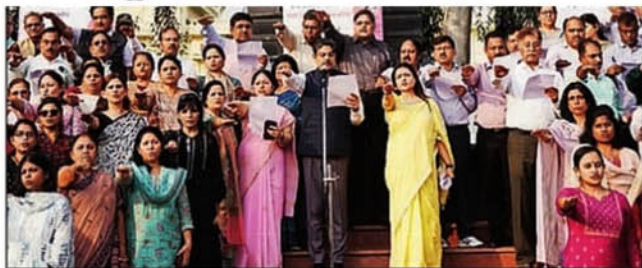
The drive is a part of Mission Shakti, a govt initiative to empower women